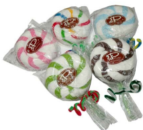
Handtuch Bade Lollie

Bade Lollie Handtuch - Badespaß für Groß und Klein. Handtuch in Lollie Form.