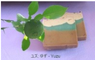
ユズ 柚子 - Yuzu