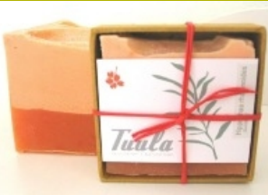
Sanddorn - Vanille

Sanddorn Fruchtsäuren, Vitamine, Sanddornfruchtfleischextrakt, Karottenöl, Walnussöl, Sheabutter echte Bourbon-Vanille und reines ätherisches Blutorangenöl.