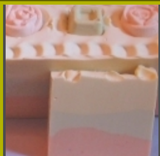
Heile Heile Röschen

Lieferbar als 100g Stück in unserer neuen Tuula Verpackung im Display