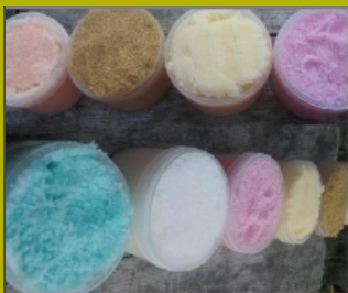
Sugar Srub Peeling

Sugar Srub Peeling Mit kaltgepresstem süßen Mandelöl, grobkörnigen Zuckerkristallen, ätherischen Ölen und Kokosmilchextrakt bei Cocos Sugar Scrub, Kokosmilchextrakt.