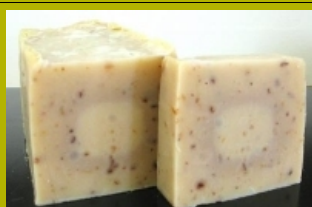
Bierseife Shampoo Pur

Lieferbar als 100g Stück in unserer neuen Tuula Verpackung im Display