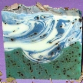
Salve - Wiesenkräuter