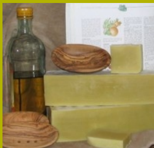
Reine kaltgesiedete Olivenölseife

Castilia Eine besondere Seife der neuen Saison. Unsere reine kaltgesiedete Olivenölseife aus kaltgepresstem Olivenöl (aus erster Pressung).